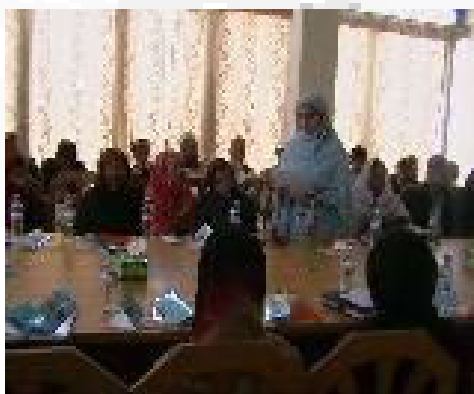
آنها، زنان را یکی از آسیب پذیرترین قشرهای اجتماعی در ننگرهار شمرده و

روی برون رفت از این معضله بحث کردند. نبود فرهنگ احترام به مقام شامخ زن، از نکات مهم این برنامه بود، که گفت و شنودی گرمی را باعث گردید. راه اندازی این کارگاه، نقش مهمی را در بلند بردن آگاهی نهادهای مدنی و دولتی، در پیوند با نقش زنان در جامعه، ایفا کرد. این کارگاه، پیوند سازنده بی را میان نهادهای جامعه مدنی و نهادهای دولتی، در تفاهم و هم آهنگی برای شناسایی معضلات زنان، ایجاد نمود. سلسله این برنامه ادامه خواهد یافت.